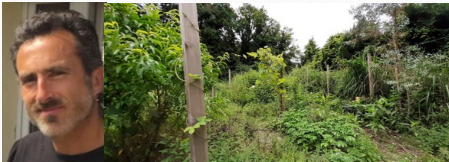
Damian MISITI est passionné par les plantes et jardine une forêt comestible, aménage des terrains pour leur ajouter diversité, résilience et agrément.