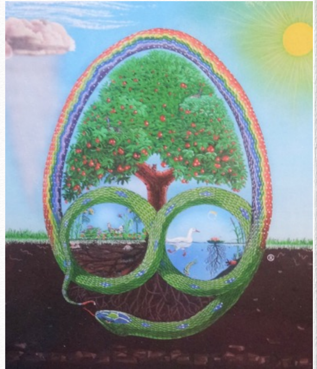
illustration de la couverture de Permaculture a designer's manual de Bill Mollison